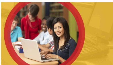
Ohio English Language Proficiency Assessment (OELPA)

Información sobre la evaluación del dominio del idioma inglés de Ohio (OELPA)